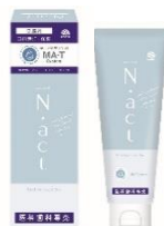
N.act オーラルリムーバルジェル （口腔化粧品） N.act オーラルジェル