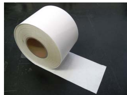
■ 幅120mm × 長さ100m