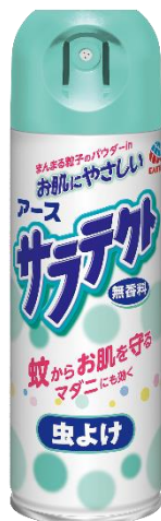
『サラテクト 無香料 200mL』

※ インテージ SRI 虫よけ剤市場 2016 年 8 月～2018 年 4 月累計販売金額（サラテクトシリーズ計）