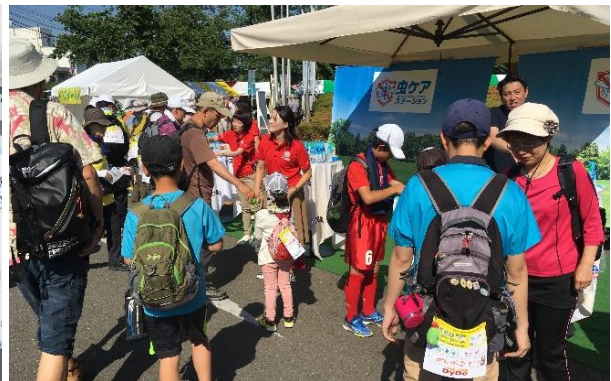
虫よけ剤の使い方を説明するスタッフ