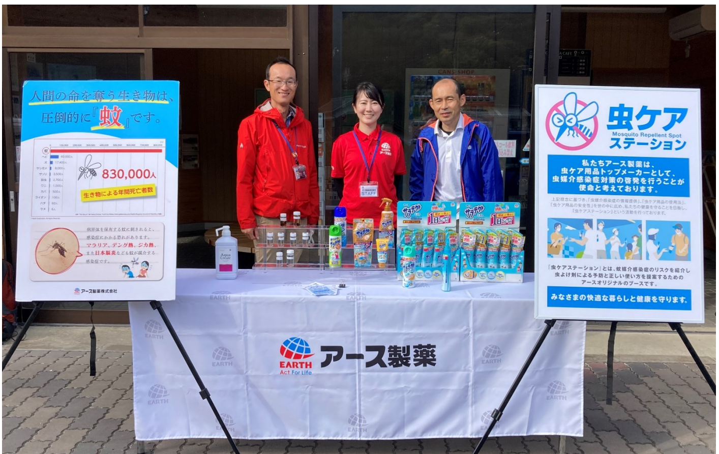
兵庫県西播磨県民局 県民交流室 地域づくり課の皆様（左右両側）とアース製薬 玉井係が虫ケアステーションを運営

当社は、令和3年12月に「県民の健康な暮らしの実現に向けた公民連携の取組」として兵庫県と包括連携協定を締結しており、「西播磨山城復活プロジェクト」の一環で実施する同ツアー全12回の参加者に「虫よけ剤」の啓発活動を行います。