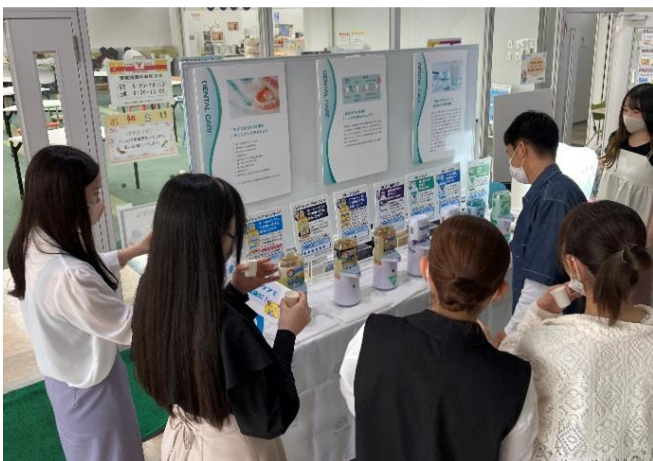
洗口液体験ブースでは、学生の皆様に各種 モンダミンを体験していただきました。