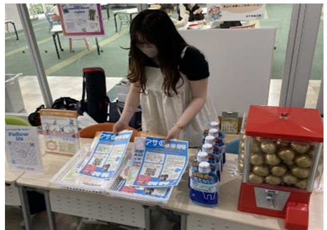
「おーらる歯びねす」に所属する学生が 「健口」への意識調査を行いました。