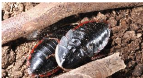
（在来種：サツマゴキブリ）