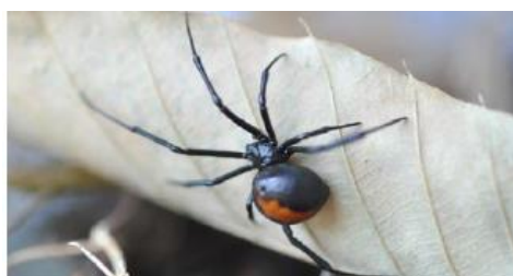
（特定外来生物：セアカゴケグモ）