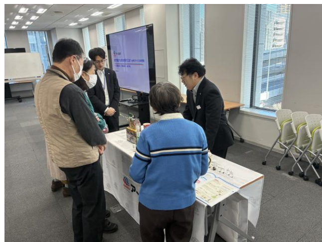
参加者から講義後に質問を受ける様子