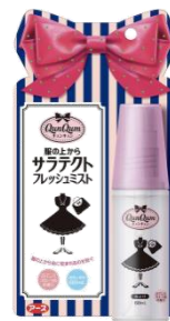
『服の上からサラテクト フレッシュミスト』