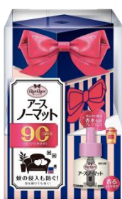
『アースノーマット』

製品ラインナップ一覧： https://www.earth.jp/qunqum/#qunqum-lineup