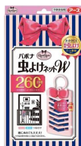
『バボナ 虫よけネットW』