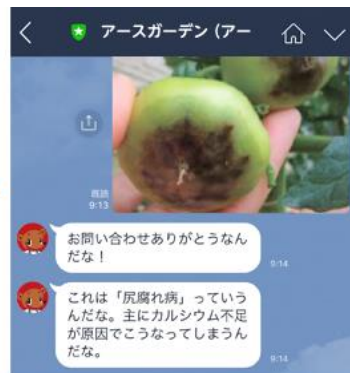
まもるくんからアドバイス