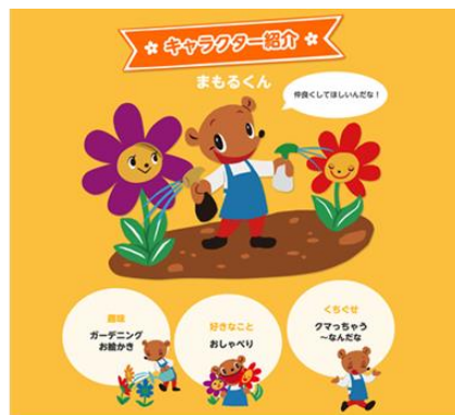
『アースガーデンキャラクター紹介』

「ガーデニングのお悩み解決ホットライン」は、アース製薬の園芸ブランド「アースガーデン」のLINE公式アカウントに友だち登録したユーザーが、ガーデニングに関するお悩みをテキスト・写真で相談すると、アースガーデンのキャラクターの「まもるくん」がお悩み解決に役立つアドバイスを無料で行うサービスです。