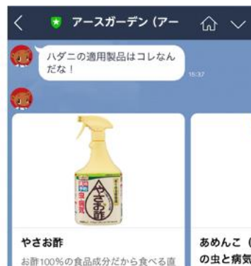
適用商品がすぐ分かる