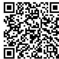
LINE 友だち追加 QRコード®