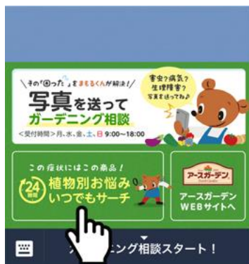
項目をタップする

※トマト・ピーマン・ナスなどをはじめ人気野菜 13種類が登録されています。今後も登録植物を続々追加予定。さらに進化していきます