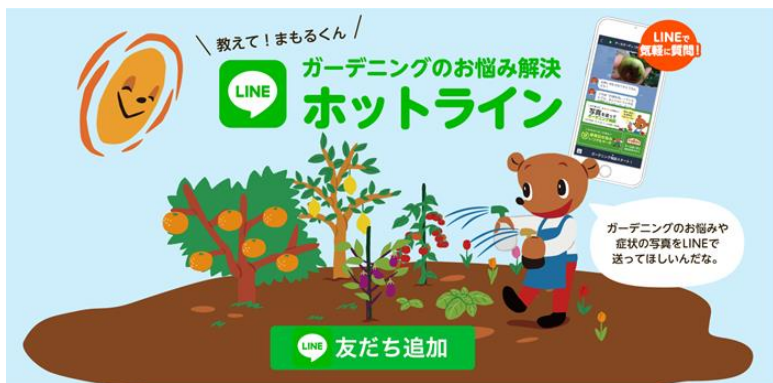
『サービス概要紹介ページTOPデザイン』

アース製薬株式会社（本社：東京都千代田区、社長：川端克宜）では、コミュニケーションアプリ「LINE」にて無料で園芸相談ができるサービス「ガーデニングのお悩み解決ホットライン」を本年3月1日に提供を開始して以来、ユーザー登録数が29000人を突破（6月1日現在）。園芸相談件数も、異例の月平均600件を超える結果となりました。