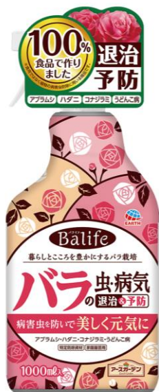
『バラの虫・病気 退治&予防 1000ml』

2年目となる2019年のスリークロスの取り組み企画第2弾として、暮らしとところを豊かにするバラ栽培「Balife（バライフ）」を発表し、当社からはバラ栽培で困る虫・病気対策の『バラの虫・病気 退治&予防』を、2019年1月21日（月）に全国で新発売します。