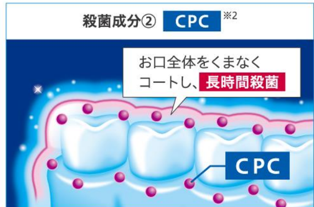
※1 イソプロピルメチルフェノール ※2 塩化セチルピリジニウム