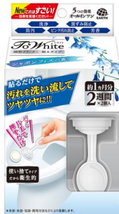
『シャボンフィズの香り』