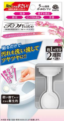
『フラワーパルフェの香り』