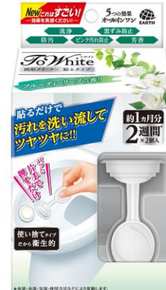
『フルーティーリーフの香り』

貼るタイプのトイレ用クリーナーは、使い捨てタイプが伸長傾向にあります。66%のお客様が「なくなるのが早い」と感じています。そこで1個で約2週間、1箱で約1ヵ月間、効果が持続するようにリニューアルしました。