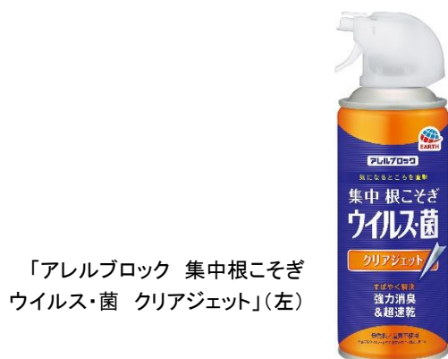
「アレルブロック 集中根こそぎ ウイルス・菌 クリアジェット」(左)

アース製薬株式会社（本社：東京都千代田区、社長：川端克宜、以下「アース製薬」）は、花粉やウイルス、ハウスダストなどの対策ができる「アレルブロック」シリーズから、新たに、気軽にできる住宅用のウイルス除去・除菌製品として、「アレルブロック 部屋まるごと ウイルス・菌 一発クリア」と「アレルブロック 集中根こそぎ ウイルス・菌 クリアジェット」の2種を発売いたしました。