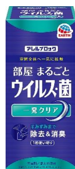
「アレルブロック 部屋まるごと ウイルス・菌 一発クリア」(右)

両製品の特長はその手軽さ。「アレルブロック 部屋まるごと ウイルス・菌 一発クリア」は床にセットしボタンを押すだけで、ガスの噴射力とオリジナル噴口により成分を部屋の隅々まで到達させ(※1)、部屋の浮遊ウイルスや付着ウイルスなどを30分で一気に除去します。