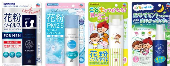
左から、「アレルブロック 花粉ガードスプレー FOR MEN クイックプロテクト」、 「アレルブロック 花粉ガードスプレー モイストヴェール」、 「アレルブロック 花粉ガードスプレー ママ&キッズ」、「アレルブロック おやすミントスプレー」

【2020年秋】“除去” アレルブロック ウイルス・菌 クリア シリーズ ウイルス・菌除去