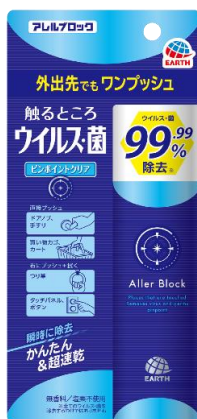
アレルブロック 触るところ ウイルス・菌 ピンポイントクリア

アース製薬株式会社（本社：東京都千代田区、社長：川端克宜、以下「アース製薬」）は、ウイルスや菌の対策ができる「アレルブロック ウイルス・菌 クリア」シリーズから、新たに、外出先でも気軽にワンプッシュでウイルス・菌が除去できる製品として、「アレルブロック 触るところ ウイルス・菌 ピンポイントクリア」を2020年11月20日(金)から、全国で発売いたします。