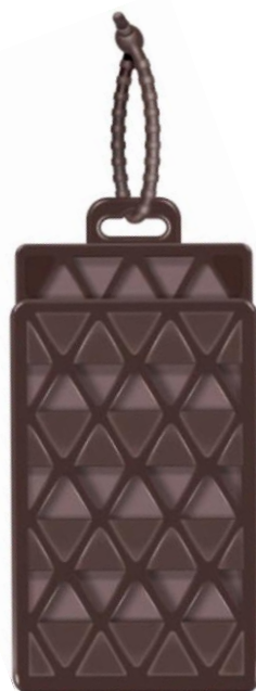
虫よけマモリーネ