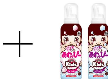
遊べる入浴 あわびー イチゴの香り/ブドウの香り

今後もアース製薬は、お風呂タイムをもっと楽しく、快適に過ごしていただけるよう、お客様のライフスタイルに合わせた入浴剤を提案してまいります。