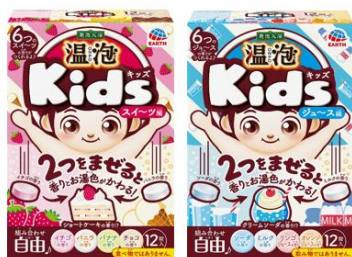
温泡 ONPO Kids スイーツ編/ジュース編