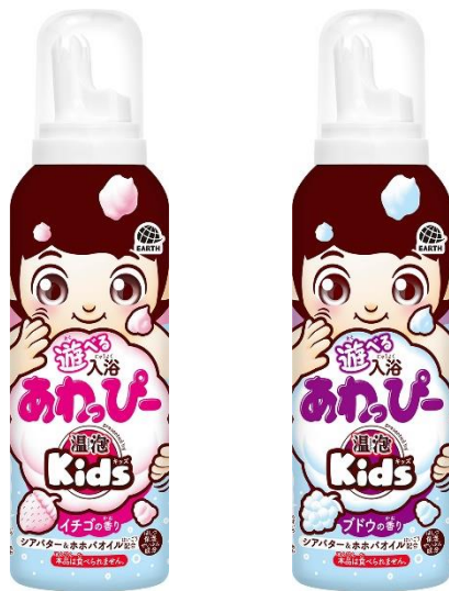
『遊べる入浴 あわっぴー イチゴの香り／ブドウの香り』

アース製薬株式会社（本社：東京都千代田区、社長：川端克宜、以下「アース製薬」）は、「温泡 Kids シリーズ」から、親子で一緒に入浴を楽しめる“入浴泡”（泡タイプの浴用雑貨）『遊べる入浴 あわっぴー（presented by 温泡 Kids）』を8月22日（月）に全国で発売します。