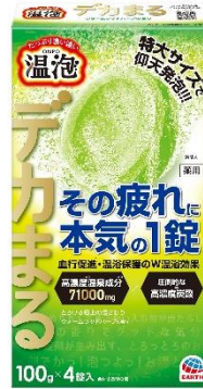
『温泡 デカまる ウォームウッドハーブの香り』