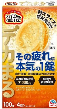
『温泡 デカまる エナジーシトラスジンジャーの香り』

アース製薬株式会社（本社：東京都千代田区、社長：川端克宜、以下「アース製薬」）は 8 月 20 日（火）に、1 錠あたり医薬部外品の承認基準で最大量である 100g の特大サイズの錠剤を使用し、血行促進 ※1 と温浴保護の温浴効果により疲労回復ができる炭酸入浴剤『温泡 デカまる』を全国で発売しました。