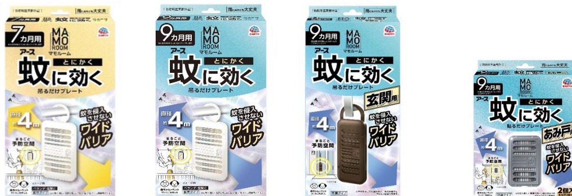
マモルーム 蚊に効く吊るだけプレート

アース製薬株式会社（本社：東京都千代田区、社長：川端克直、以下「アース製薬」）は、2月3日（月）に、「お部屋をまるごと予防空間」がコンセプトの虫よけブランド『マモルーム』から、しっかり蚊に効く効果と生活空間に馴染むナチュラルで親しみやすいデザインの蚊よけ『マモルーム 蚊に効くプレート』シリーズを、全国で発売します。