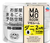
マモルーム ダニ用 2ヵ月用セット