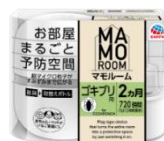
マモルーム ゴキブリ用 2ヵ月用セット 防除用医薬部外品 (アース虫ケア HAT1-2)