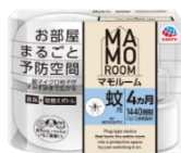
マモルーム 蚊用 4ヵ月用セット 防除用医薬部外品 (アースリキッド R4)

“お部屋まるごと予防空間”をコンセプトに、家庭のインテリアに馴染みながらもしっかりと効果を発揮する虫よけブランドです。予防しておうちの中を蚊やダニ、ゴキブリと出会わない“あんしん”空間を提案しています。