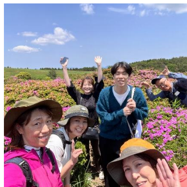
ウォーキングイベント