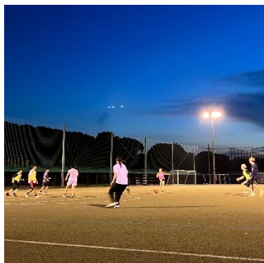
サッカー&フットサル部の活動

赤穂事業所内では、1993 年から業務開始前に任意で参加できるラジオ体操を流し、各々やりやすい場所で実施しています。ラジオ体操が始まらないと業務が始まらないと感じてしまうほど習慣化している活動です。仕事のエンジンをかける役割も果たしており、頭の切替えと同時に身体を動かす事によりスッキリと業務に取り組むことができ、業務の生産性や創造性向上に繋がっています。