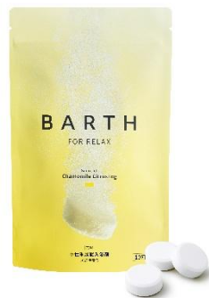
薬用BARTH中性重炭酸入浴剤RELAX Chamomile CitrusFog